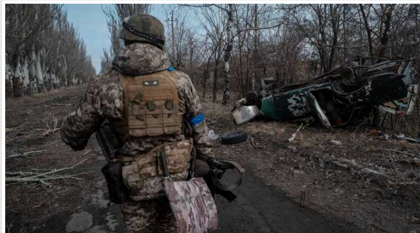
ISW: Російським військам буде важко атакувати позиції ЗСУ західніше Авдіївки

Російським військам, швидше за все, буде важко просунутися на захід від Авдіївки Донецької області ближче до підготовлених позицій, на які відходять українські війська.