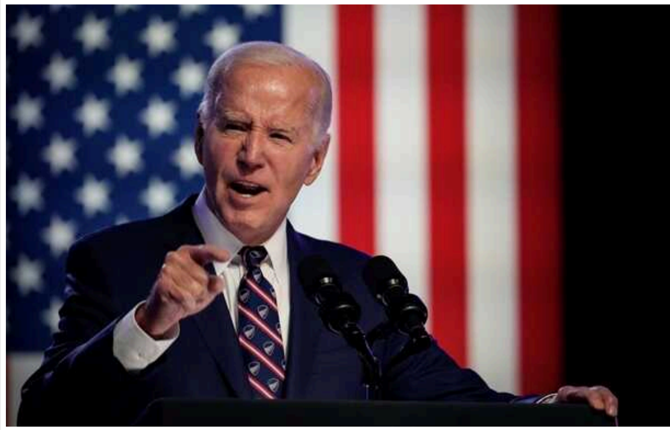
Байден "використав" Навального, щоб натиснути на Конгрес

Президент Сполучених Штатів Джо Байден відреагував на повідомлення про смерть Олексія Навального, використовуючи цей момент для того, щоб повернути увагу Конгресу та суспільства до необхідності надання фінансової підтримки Україні. Американський президент вважає, що за смерть російського опозиціонера відповідальний Путін.