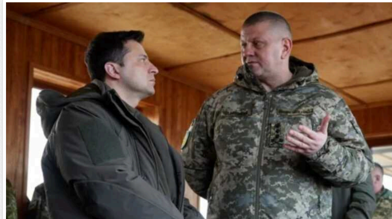
The Washington Post. Коментарі про сварку Зеленського та Залужного оплачувались із Кремля

Російська влада готова платити 40 тис. дол. за антиукраїнську публікацію у західних ЗМІ, розповіли журналісти-розслідувачі The Washington Post.