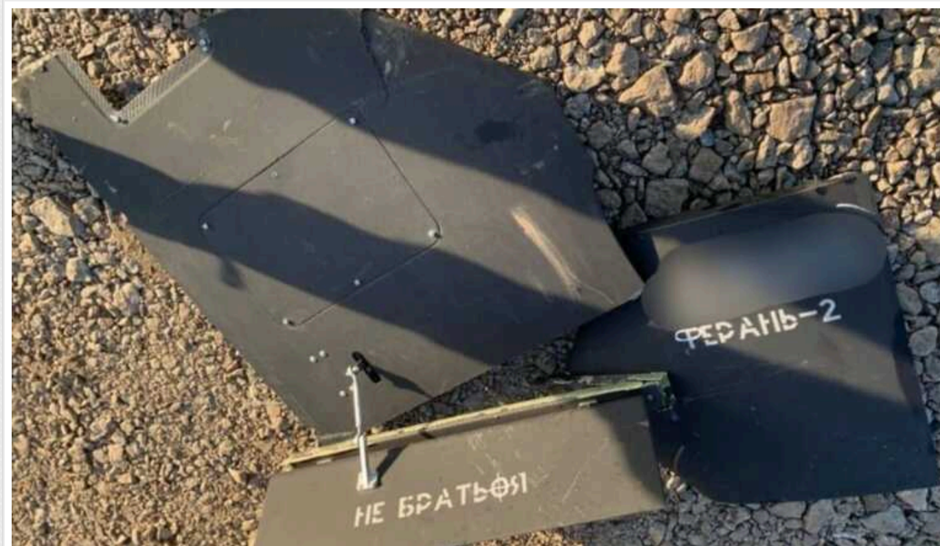
У "Шахедах", якими обстрілювали Київ, виявили компоненти зі США та Швейцарії, – НАЗК

Росія почала застосовувати ударні дрони Shahed-136 чорного кольору для ускладнення нічної роботи української ППО.