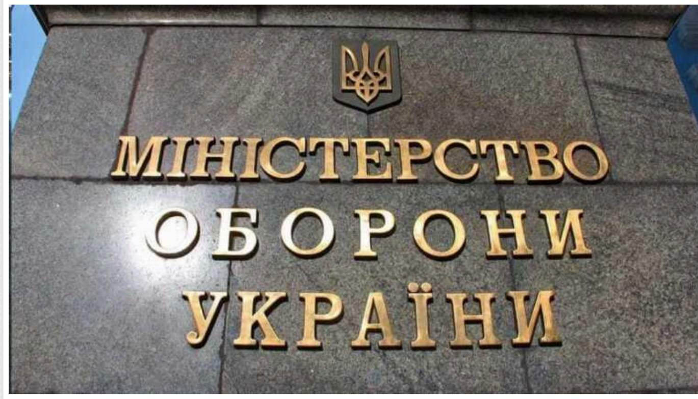
Уряд затвердив нову процедуру списання військового майна

Кабінет міністрів 16 лютого вніс зміни до положення про порядок обліку, зберігання, списання та використання військового майна у Збройних Силах, які дозволяють спрости саму процедуру списання.