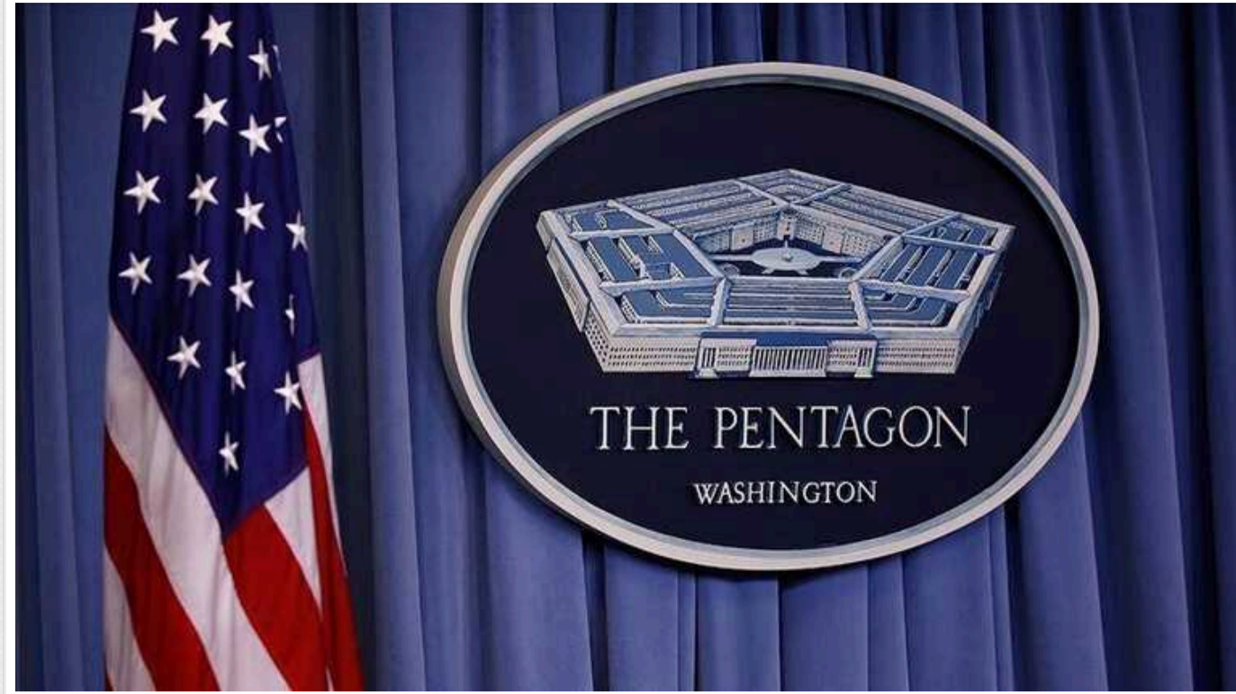
Пентагон продовжує постачати Україні зброю за попередніми контрактами

Виробництво американської зброї для постачання Україні продовжується за раніше укладеними контрактами всупереч те, що Конгрес США поки не затвердив додаткове фінансування для допомоги Києву.