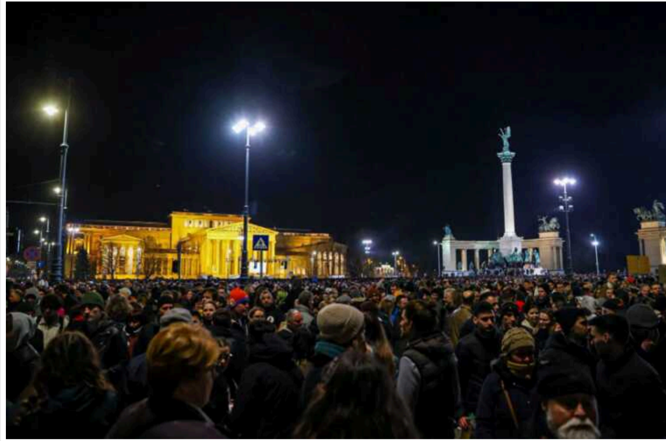
У столиці Угорщини зібрався багатотисячний мітинг незадоволених політикою Орбана

У Будапешті десятки тисяч угорців вийшли на протест через реакцію влади на "педофільський скандал". Мітингувальники зібрались на площі Героїв, після чого взяли в облогу штаб-квартиру правлячої партії "Фідес".