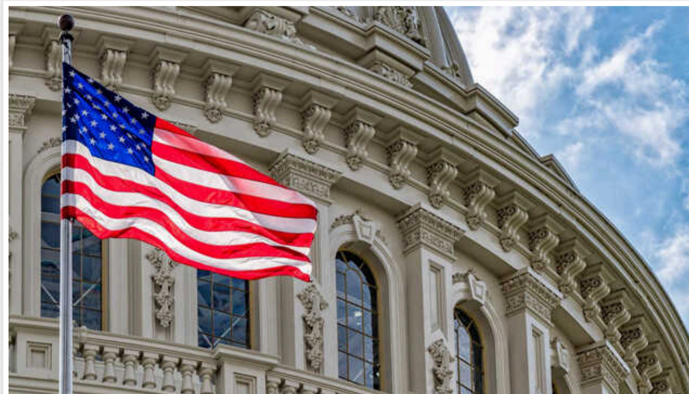
Демократи та республіканці представили новий законопроект із підтримкою України

Двопартійна група конгресменів у Палаті представників Сполучених Штатів представила новий законопроект про додаткове фінансування. Документ містить у собі як допомогу Україні, Ізраїлю й Тайваню, так і фінансування заходів щодо посилення кордону США.