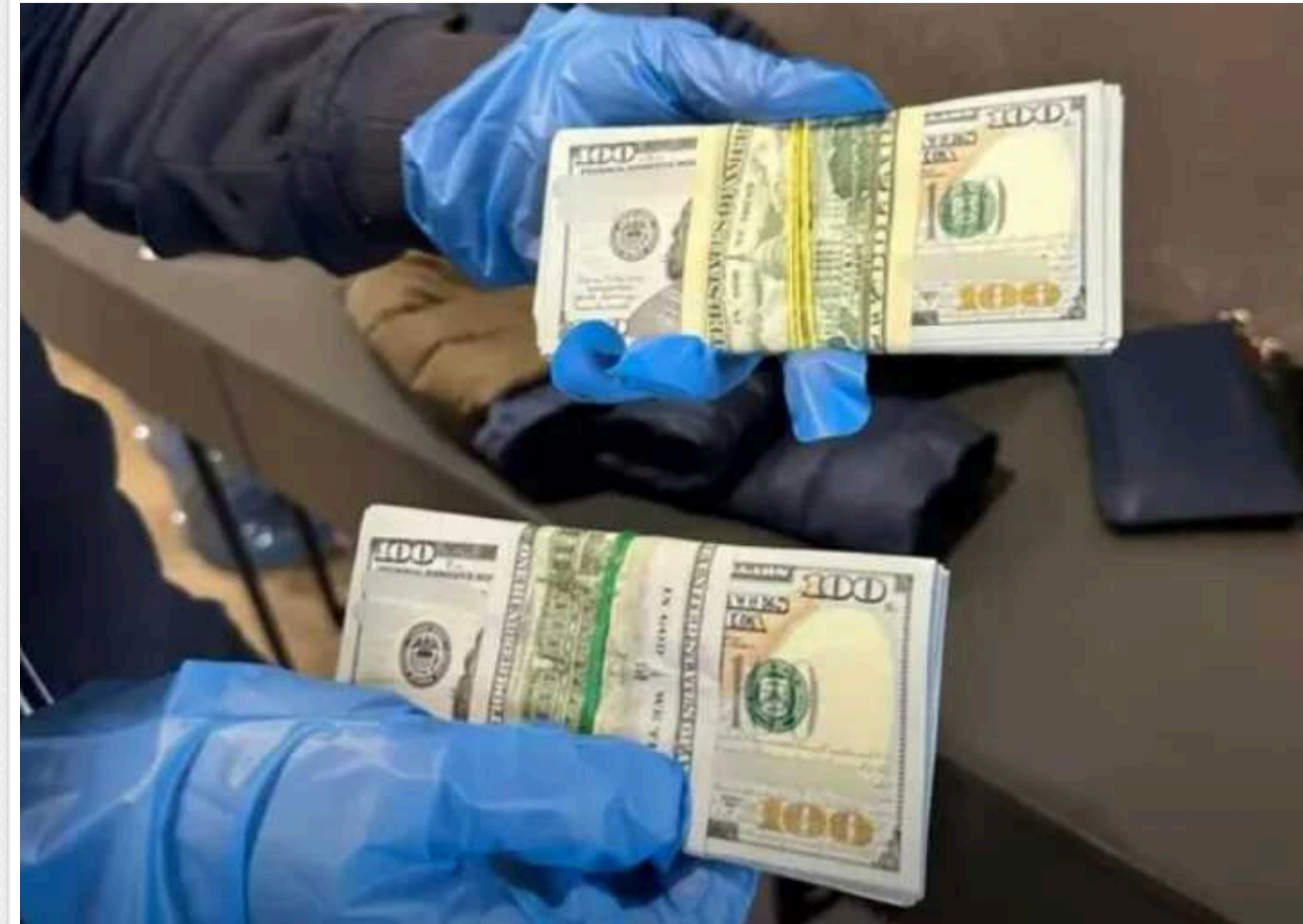
Працівниця податкової, яку затримали на одержанні 55 тисяч доларів хабаря, може вийти під заставу

Вищий антикорупційний суд 16 лютого обрав запобіжний захід посадовій особі з податкової служби Харківщини, яку раніше затримали на одержанні 55 тис. доларів США хабара. ВАКС лише частково задовольнив клопотання прокурора Спеціалізованої антикорупційної прокуратури.