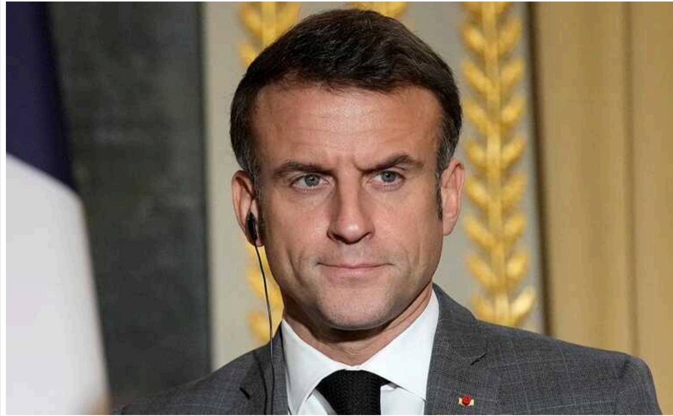
Президент Франції знову анонсував візит до Києва та назвав терміни

Президент Франції Еммануель Макрон планує відвідати Україну. Свій візит він хоче здійснити до середини березня.