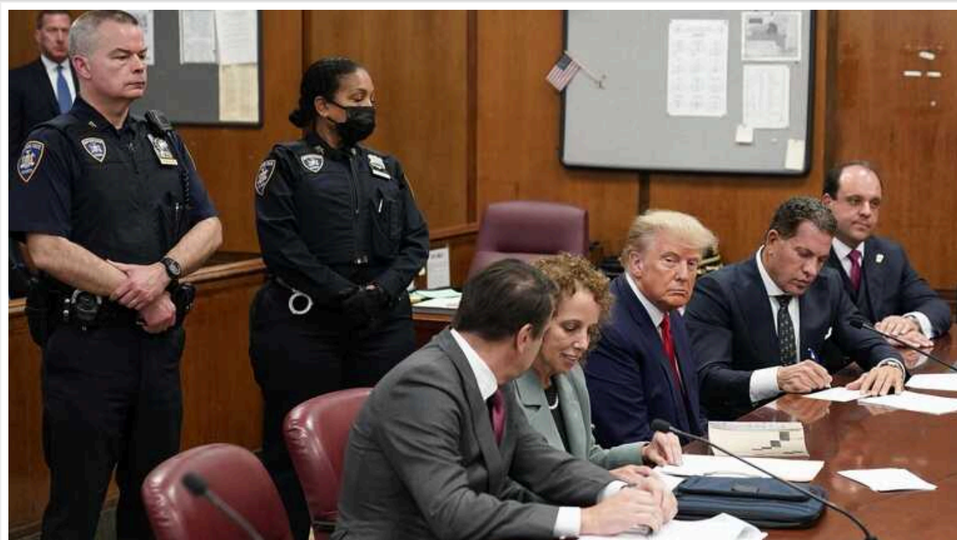
Суд у Нью-Йорку визнав експрезидента США Дональда Трампа винним у цивільній справі про шахрайство

Трам у справі про шахрайство має виплатити понад $350 млн.