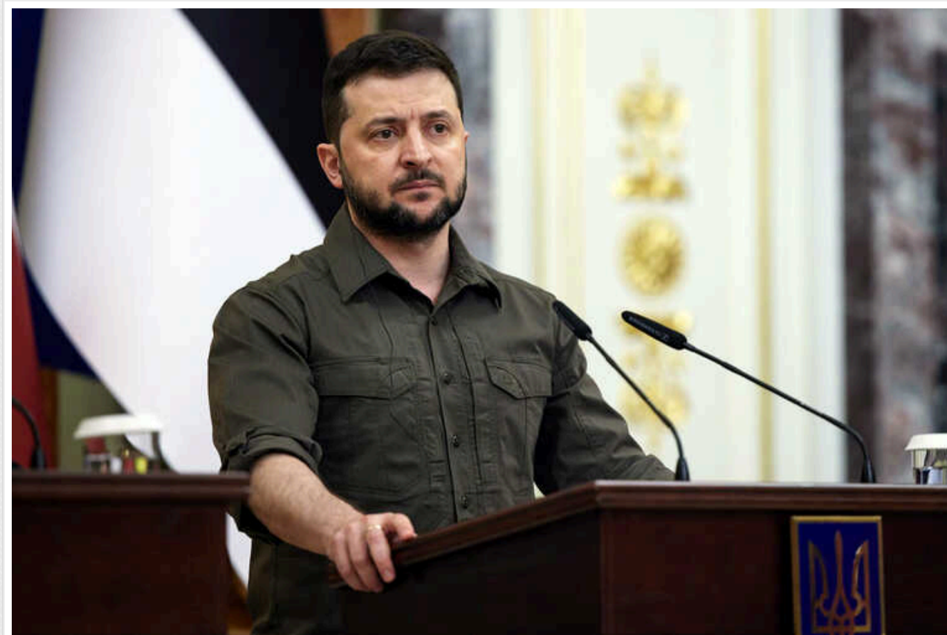
Росія проводить дезінформаційну кампанію, щоб підірвати позиції Зеленського

Про це пише The Washington Post із посиланням на документи, отримані європейською розвідувальною службою.