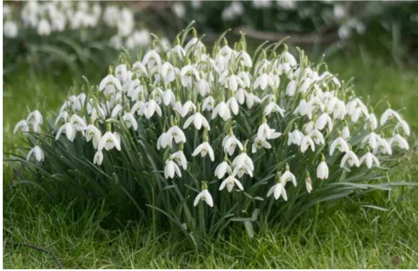
Українців штрафуватимуть за торгівлю квітами: про які рослини йдеться

Напередодні початку цвітіння первоцвітів українцям нагадали, що торгівля цими квітами – незаконна, а тому карається штрафами. Їхній розмір становить від 1 700 до 3 655 грн.