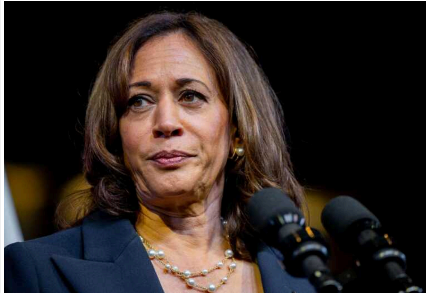
Втрати Росії у війні з Україною в 5 разів більші, ніж за 10 років в Афганістані, - віцепрезидент США

Втрати особового складу Російської Федерації у війні проти України вп'ятеро більші, ніж за 10 років в Афганістані.