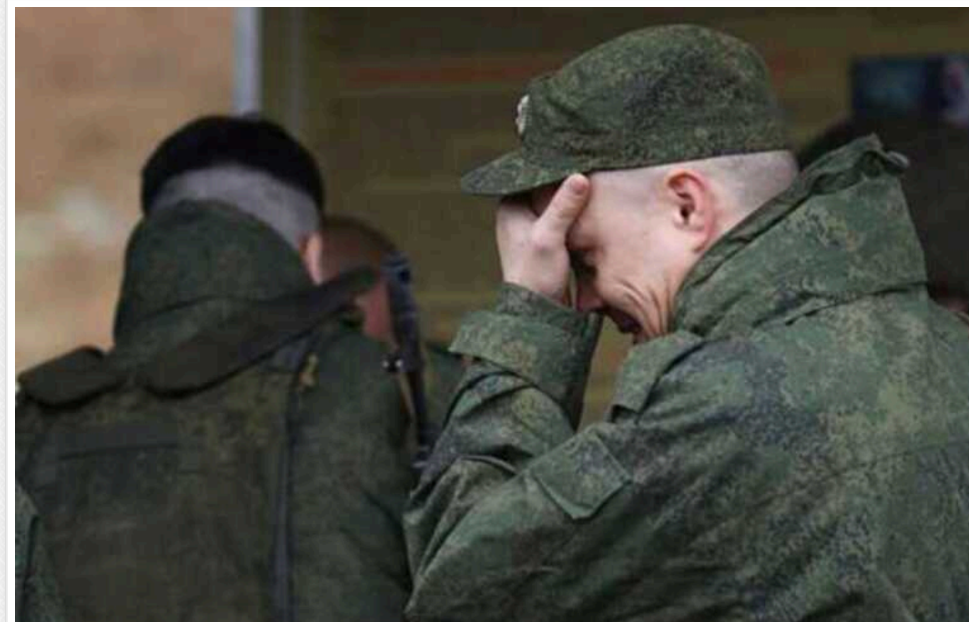
Російські "мобіки" поскаржилися, що їх кидають на фронт, незважаючи на стан здоров'я: "Немає пальців – можна в стрільці"

Російське командування кидає на війну проти України навіть мобілізованих з інвалідністю. Зокрема, така ситуація спостерігається у в/ч 11096 країни-агресорки.