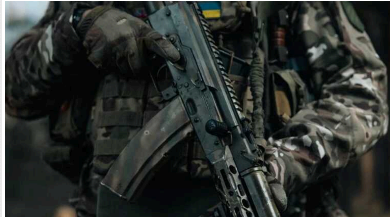
Проти сил 3-ї ОШБР в Авдіївці – не менше 15 тисяч одиниць особового складу ворога

Бійці ЗСУ завдали критичних ушкоджень 74-й та 114-й окремим мотострілецьким бригадам ЗС РФ. Обидва ворожі підрозділи - фактично "стерті".