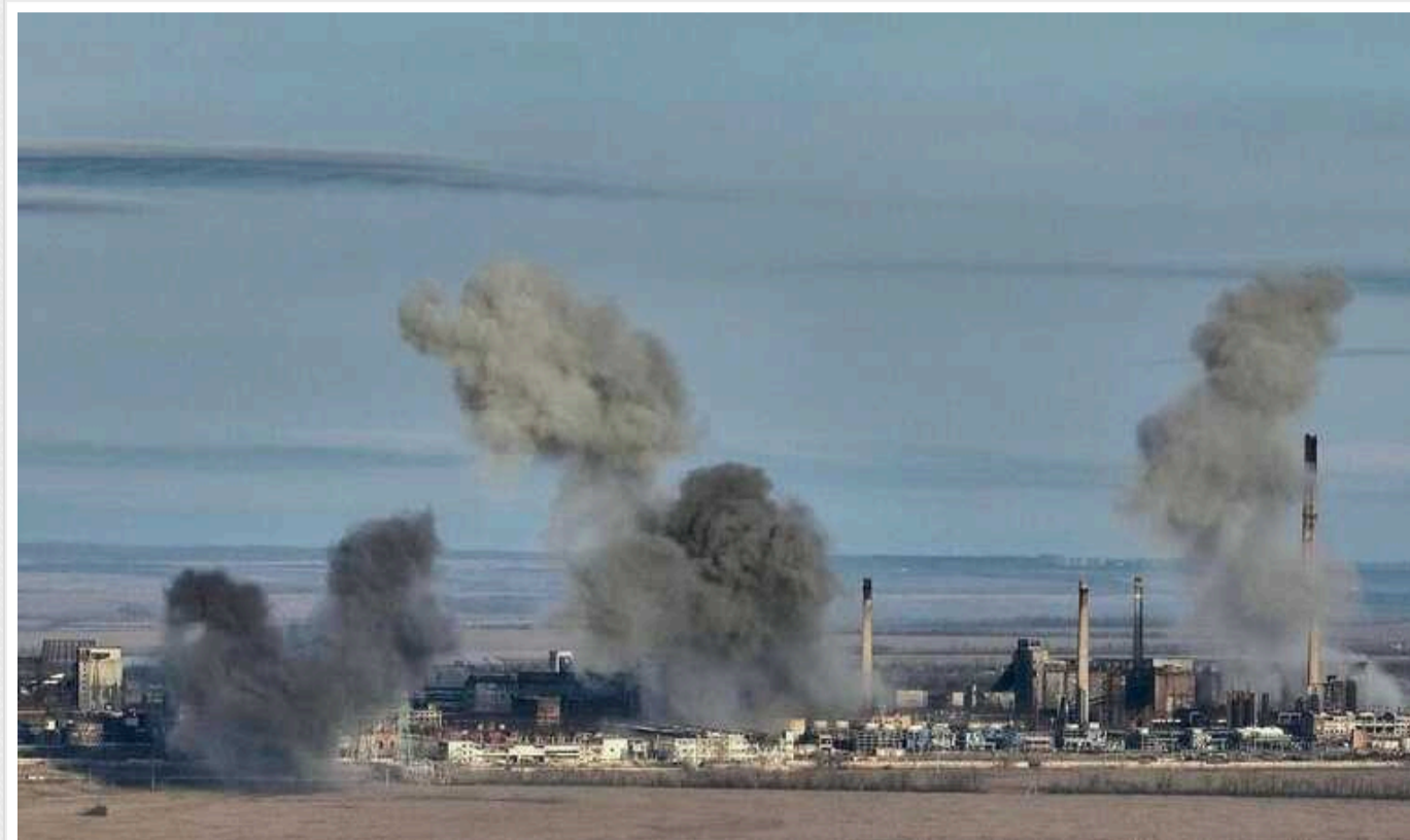
В Авдіївці окупанти фосфорними зарядами запалили цистерни з мазутом

Російські окупанти активніше тиснуть на Авдіївку. Наразі ситуація у місті критична. Ворог регулярно застосовує фосфорні боеприпаси та КАБи.