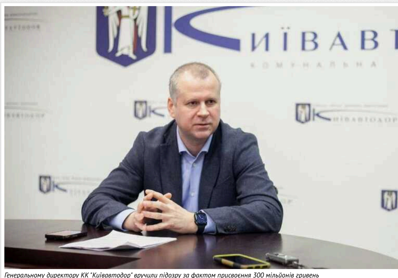
Генеральному директору КК "Київавтодор" вручили підозру за фактом присвоєння 300 мільйонів гривень

Генеральному директору КК "Київавтодор" та колишньому керівнику одного з комунальних підприємств Києва повідомлено про підозру у завданні збитків на суму майже 300 млн грн через незаконне поховання відходів на земельних ділянках, призначених для складування снігу.