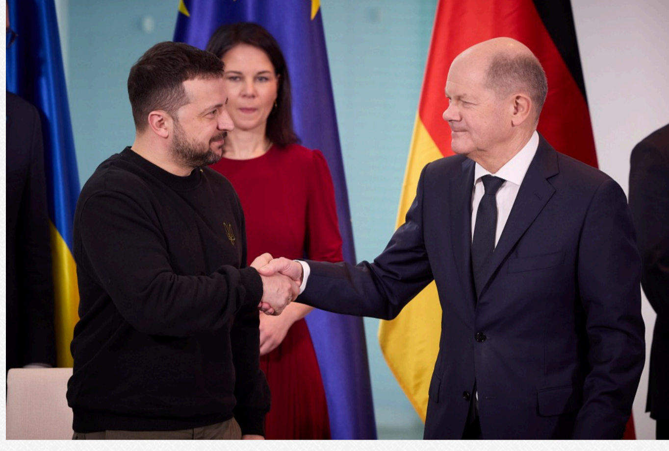
Фото: Володимир Зеленський та Олаф Шольц на церемонії підписання угоди (president.gov.ua)

За його словами, такі гарантії мають стримати Росію від агресії у майбутньому. Він також зазначив, що приклад Британії та Німеччини наслідуватимуть інші країни. Зазначимо, сьогодні такі угоди буде підписано і з Францією. Також Шольц надіслав, що Україна зобов'язується продовжити реформи, а Берлін зі свого боку гарантує військову, фінансову, економічну та гуманітарну допомогу.