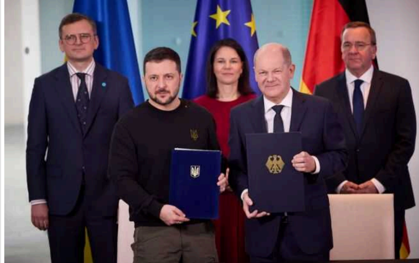
Гарантії на 10 років: що дає Україні угода щодо безпеки з Німеччиною

Україна та Німеччина підписали угоду про "гарантії безпеки". Таким чином, німецька сторона стала другою після Великобританії, яка взяла довгострокові зобов'язання щодо підтримки нашої країни.