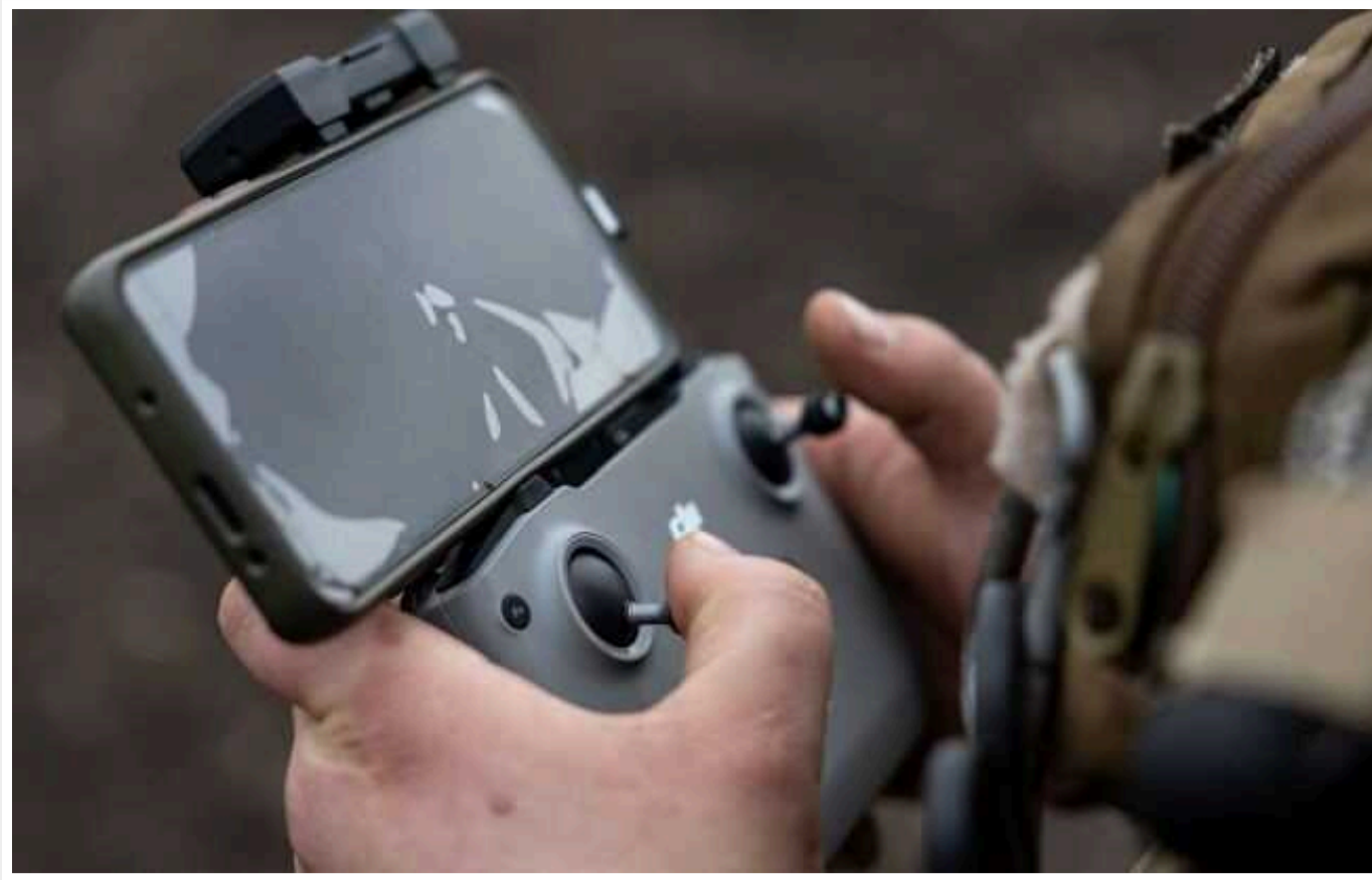
Ворожа МЛТБ не змогла втекти від українських дронів

Українські військові з роти ударних безпілотників «Булава» 72-ї окремої механізованої бригади імені Чорних Запорозжців FPV-дронами наздогнали та знищили тікаючий російський бронетранспортер МЛТБ.