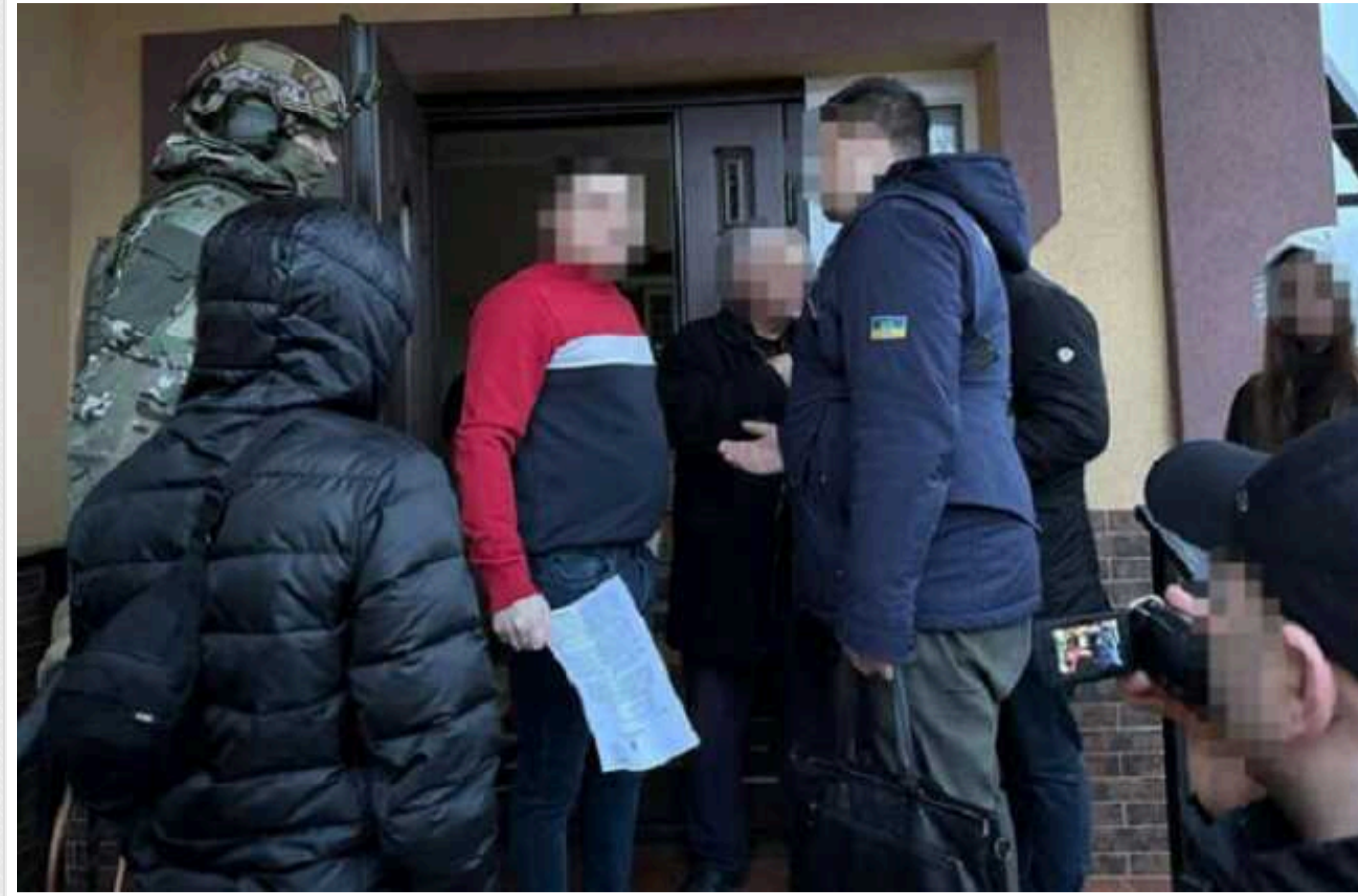
ДБР повідомило про підозру кіберзлочинцю: виманював банківські дані у громадян Канади та США

Працівники ДБР повідомили про підозру чоловіку, який викрадав персональні та банківські дані за допомогою шкідливого програмного забезпечення та фішингу. Жертвами шахрая були громадяни Канади та США. Отримані дані українець продавав за криптовалюту. Слідство встановило, що таким чином фігурант незаконно заробив щонайменше 3,5 млн грн.