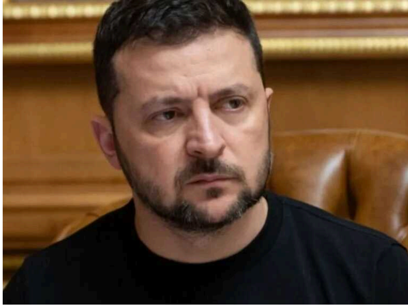
Зеленський прокоментував ситуацію в Авдіївці: Найголовніше - це військові

Читати на русском Read in English Додати як бажане джерело в Google