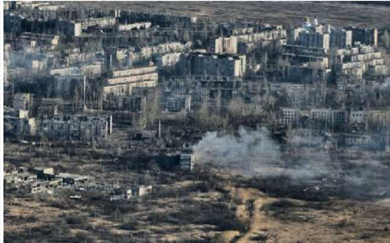
Українські бійці відійдуть з позиції "Зеніт" в Авдіївці, - Тарнавський

"Після багатьох місяців протистояння, командування ОСУВ прийняло рішення відійти з позиції "Зеніт" на південно-східній околиці Авдіївки. Ми тримати цю позицію стільки, скільки це давало можливість ефективно стримувати та знищувати ворога", - написав командувач ОСУВ "Таврія" Олександр Тарнавський.