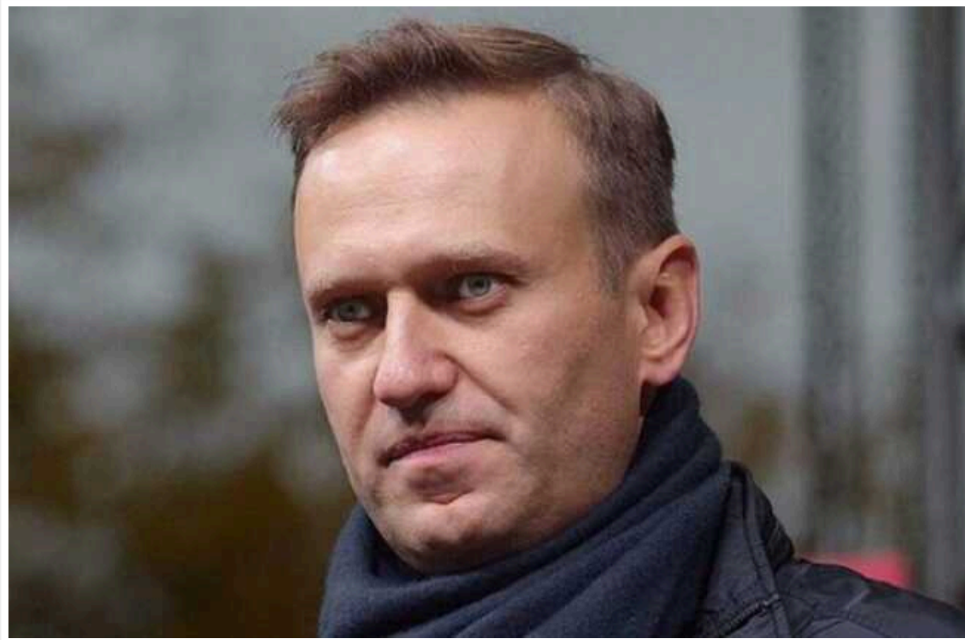
РосЗМІ повідомляють, що у Навального відірвався тромб

За даними РосЗМІ, причина смерті Олексія Навального - тромб, що відірвався.