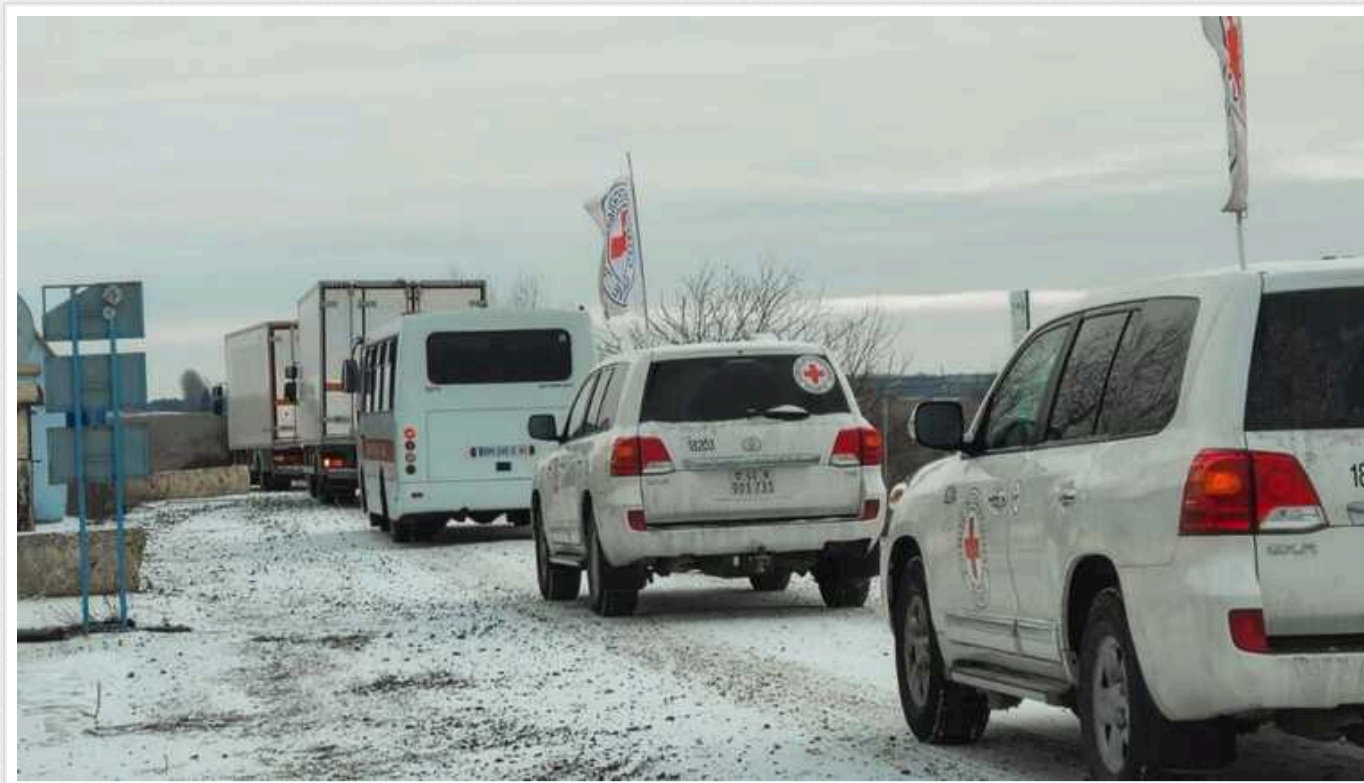
Україна повернула додому тіла ще 58 загиблих захисників