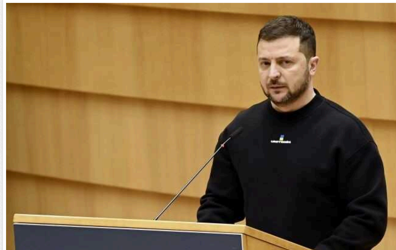
Зеленський звернувся до учасників виставки в Швеції, присвяченій спільній історії держав: "Ми маємо зміцнити наші союзи та альянси"

У Швеції відкрилася виставка, присвячена спільній із Україною історії. Президент Володимир Зеленський звернувся до учасників заходу та подякував за підтримку.