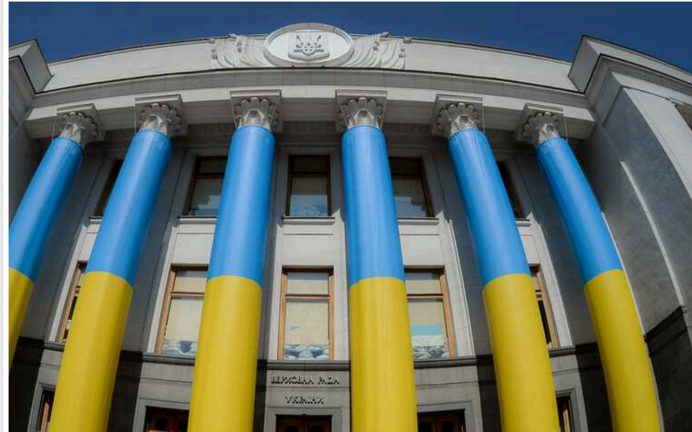
У ВР пообіцяли відкрити кулуари: 30 журналістів допустять до засідань парламенту

Після вирішення усіх безпекових питань і перекредитації журналістів для медійників відкриють кулуари парламенту, заявив очільник комітету з питань свободи слова Ярослав Юрчишин.