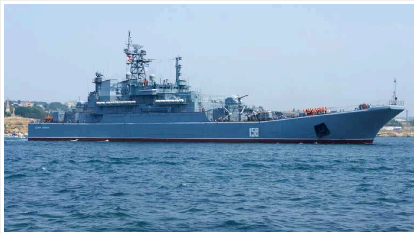
Україна перемагає Росію на морі, — The Economist

Поки перевага Росії в артилерійських обстрілах зростає, Україна перемагає країну-агресорку на морі, оскільки операції проти Чорноморського флоту РФ приносять «вражаючі результати», йдеться у матеріалі The Economist .