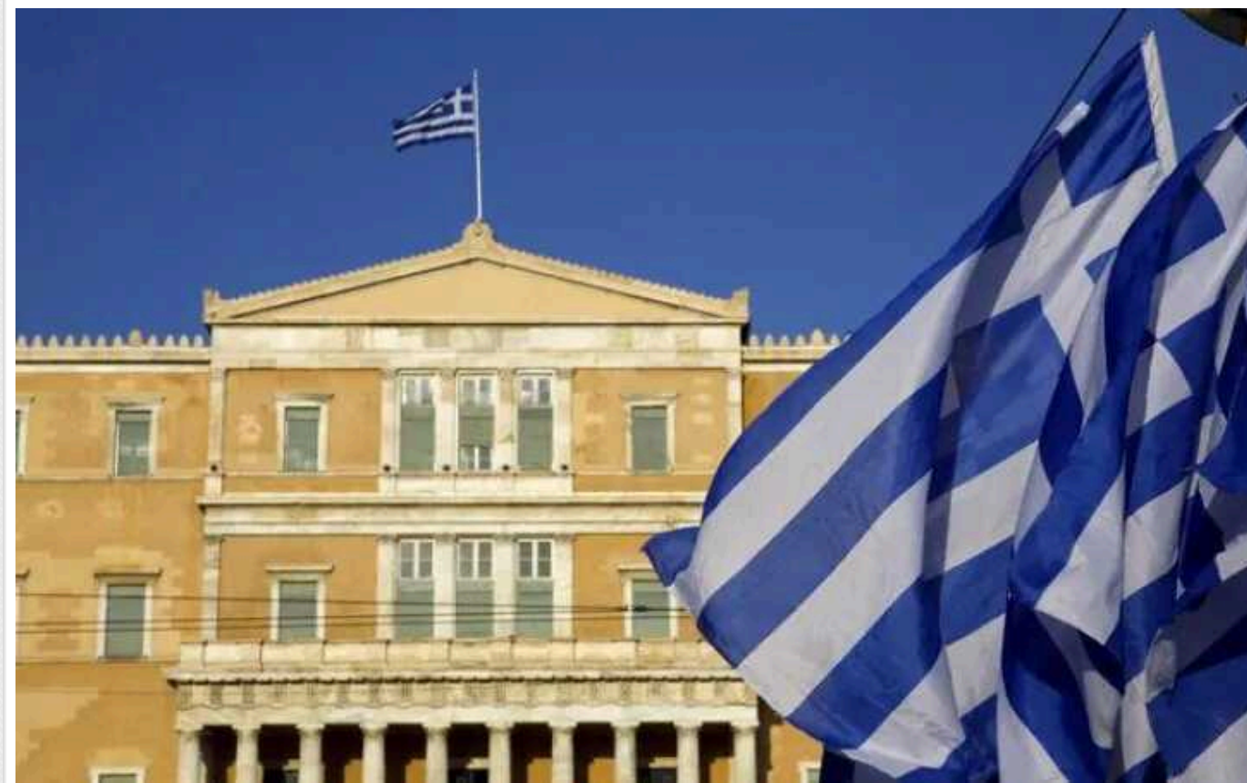
Греція стала першою православною країною, яка легалізувала одностатеві шлюби

Парламент Греції ухвалив закон, що дозволяє укласти одностатеві шлюби на території країни, він набуде чинності після публікації в офіційному урядовому бюлетені. За легалізацію одностатевих шлюбів 15 лютого проголосували 176 депутатів із 300.