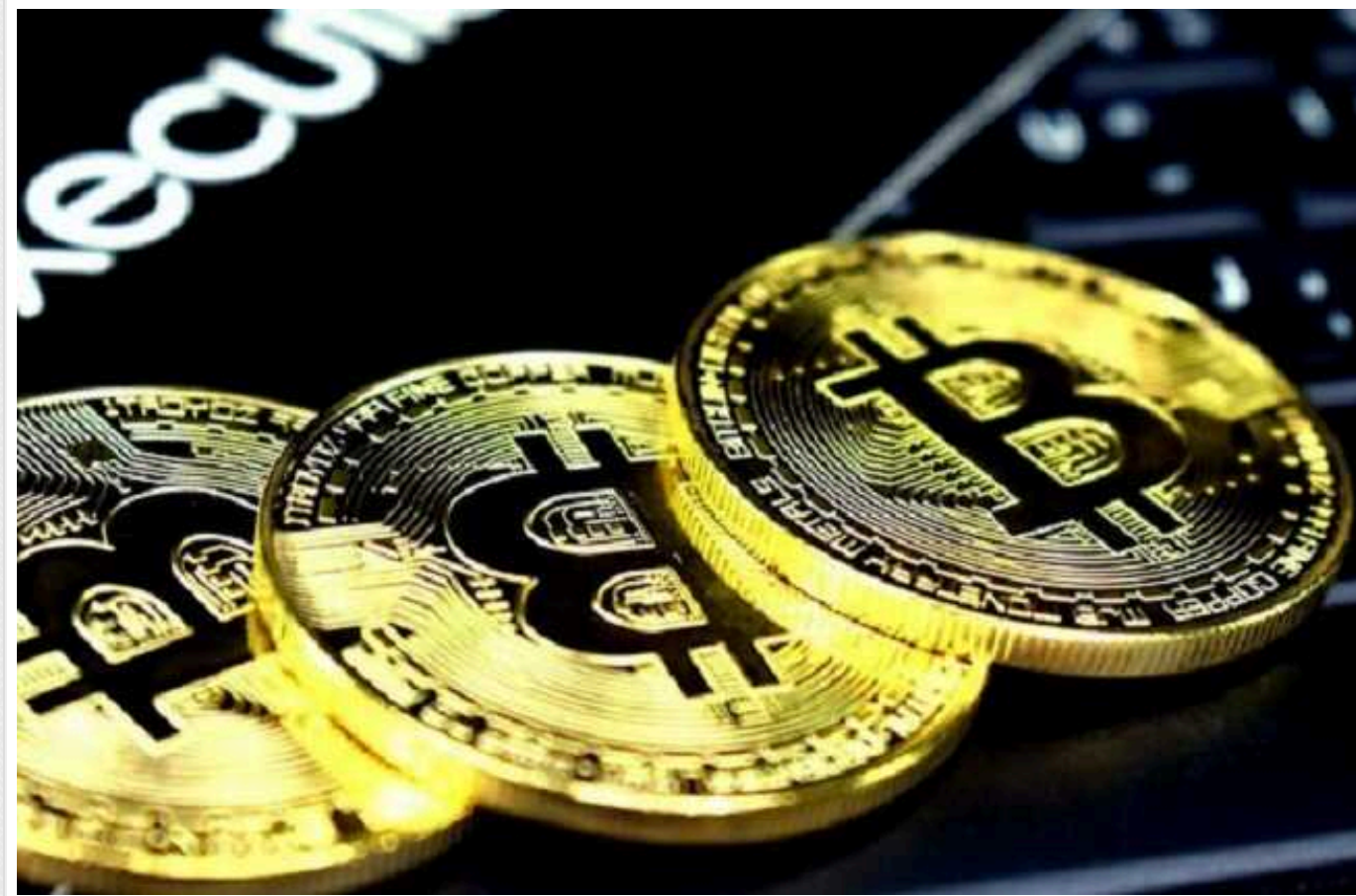
ВР не розглядатиме пропозицію пільгового оподаткування криптовалюти

Верховна Рада не розглядатиме пропозицію запровадити пільгове оподаткування доходів фізичних осіб від операцій з криптовалютою, підтриману Мінцифри.