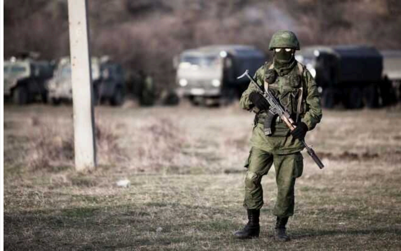
Окупанти привозять на ТОТ студентів з Якутії задля ідеологічної обробки однолітків

В Докучаєві на ТОТ Донеччини росіяни влаштували "концерт дружби з Якутією". Для цього окупаційна адміністрація регіону привезла до міста делегацію з арктичного державного інституту культури з Якутії, РФ.