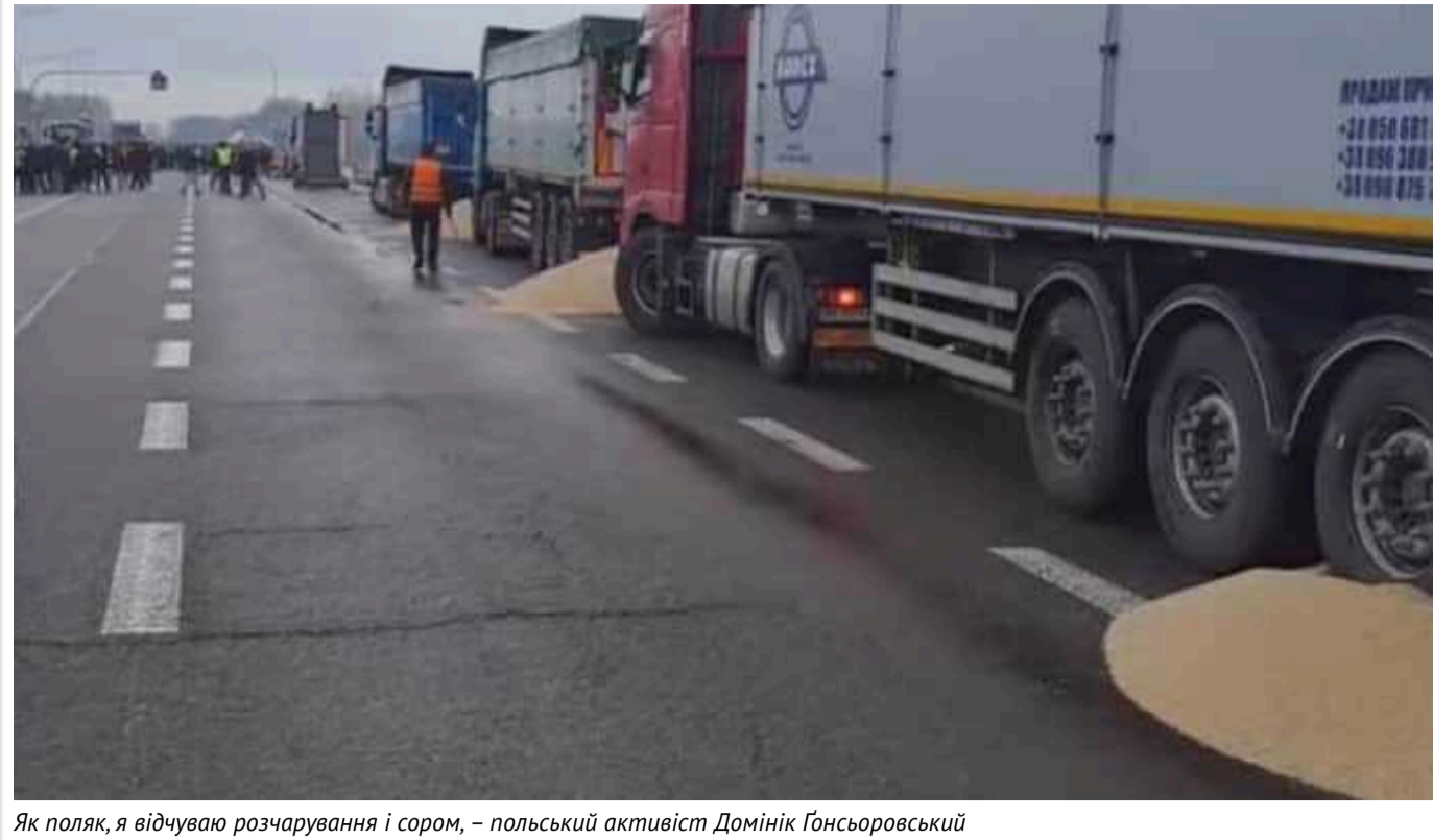
Як поляк, я відчуваю розчарування і сором – польський активіст Домінік Гонсьоровський

Головна польського сценариста, журналіста і громадського активіста Домініка Гонсьоровського.