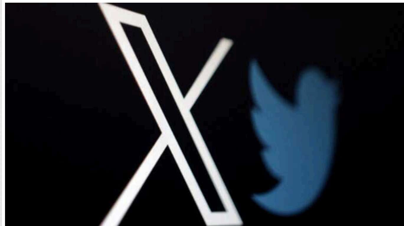
Twitter продає «галочки» терористам та російським державним ЗМІ

Соціальна мережа Twitter, яка належить Ілону Маску, продає свою синю "галочку" терористам із "Хезболли", російським державним ЗМІ і не лише.