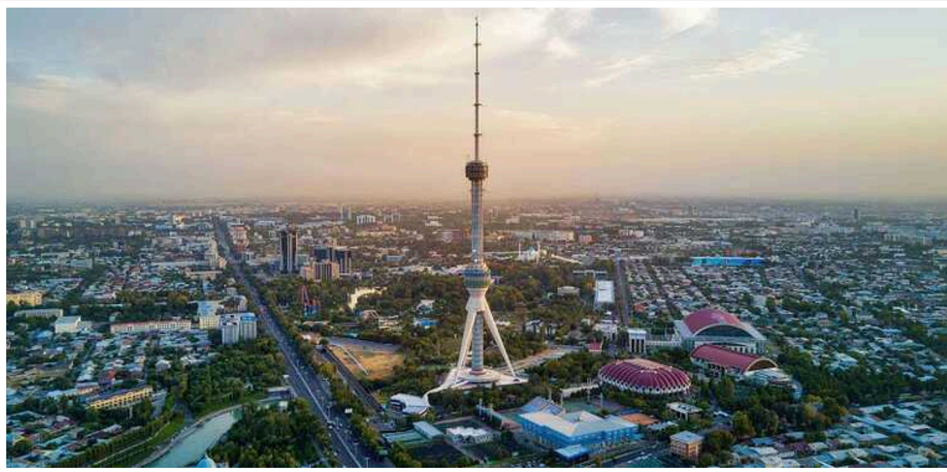
В Узбекистані хочуть заборонити відкривати рахунки в банках підсанкційним особам

У парламенті Узбекистану підтримали законопроект, який може заборонити відкривати банківські рахунки підсанкційним особам. Це може торкнутися росіян.