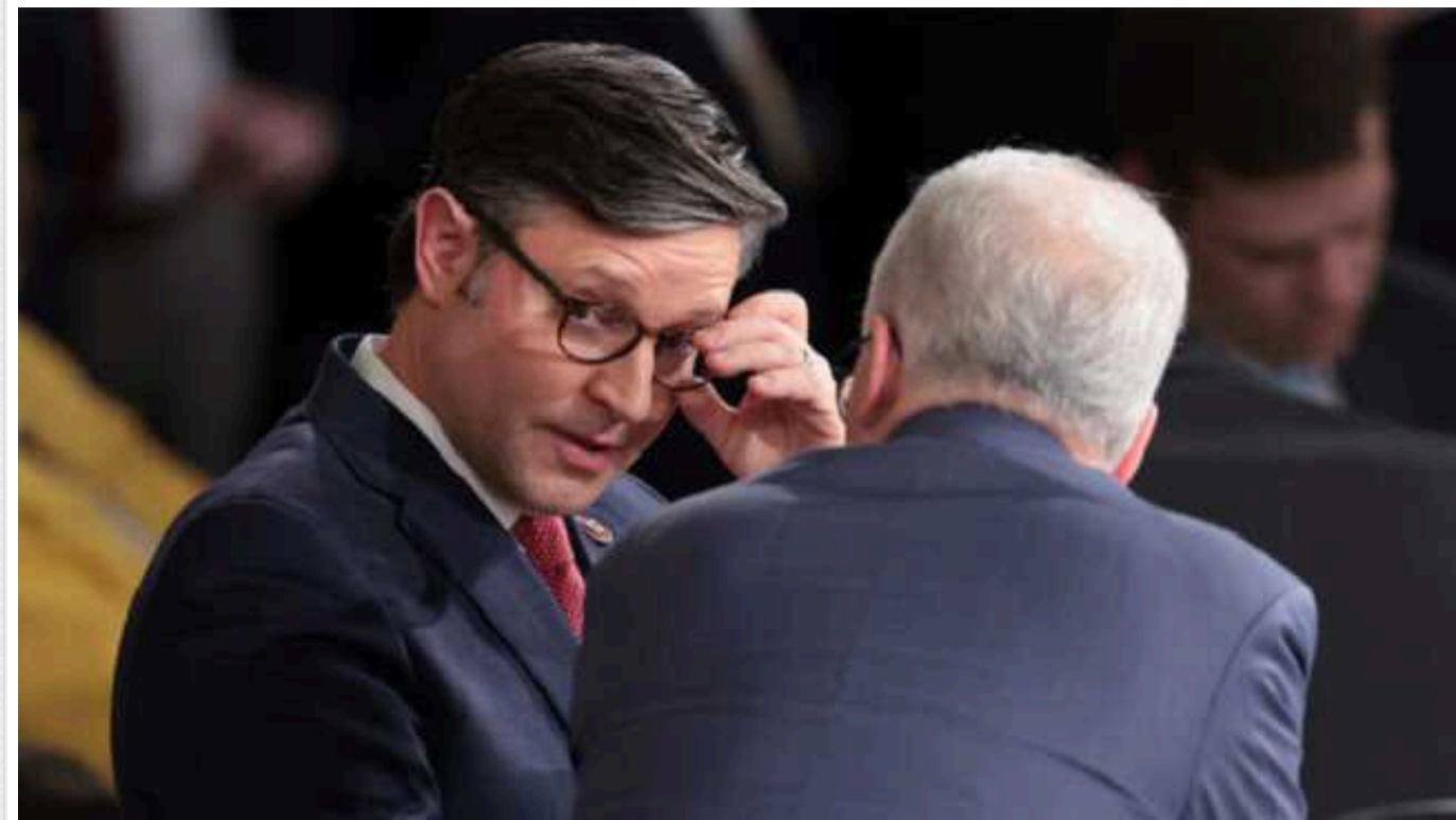
Білий дім розкритикував спікера Майкла Джонсона, який відправив на канікули Нижню палату Конгресу США: залишив без розгляду схвалений Сенатом пакет допомоги Україні

Заступник речника Білого дому Ендрю Бейтс зазначив, що Джонсон скоротив робочий час і пішов на канікули "замість того, щоб покласти край шкоді, яку він завдає нашій національній безпеці".