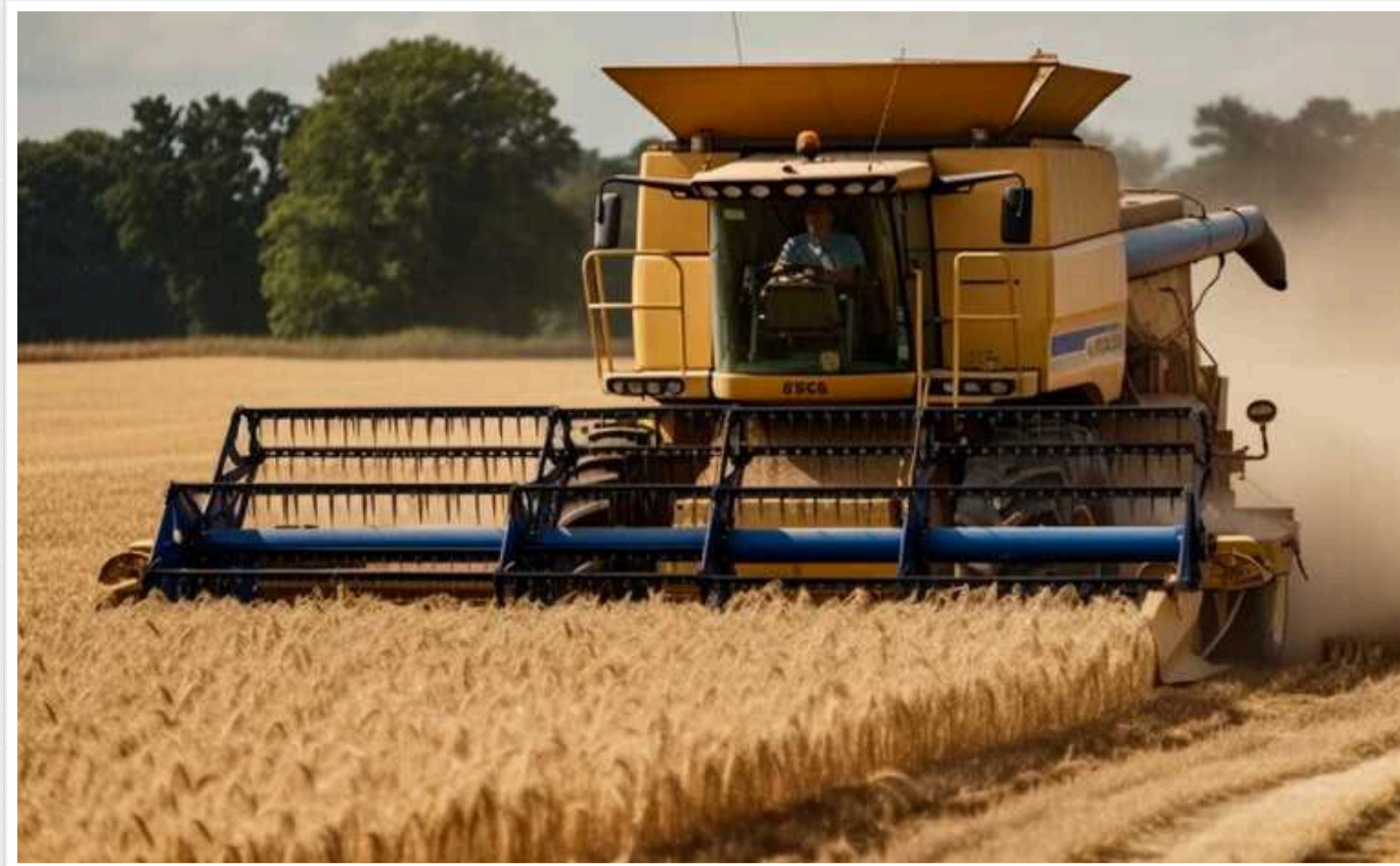
Фермерські об'єднання ЄС зажадали посилити контроль за імпортом з України

Їхнє спільне звернення 15 лютого поширило найбільша в ЄС фермерська група COPA-COGECA.