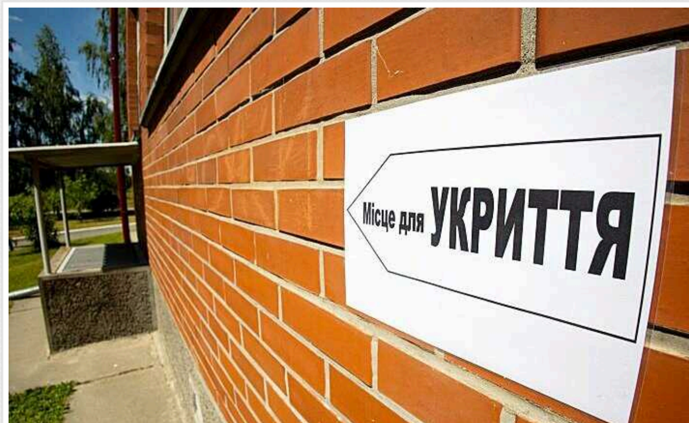
На Вишгородщині вкладуть понад 3 мільйони гривень у ремонт шкільного укриття

Відділ освіти Пирнівської сільської ради оголосив тендер. Шукають підрядника, який проведе капітальний ремонт підвального приміщення під найпростіше укриття у ліцеї на Вишгородщині.