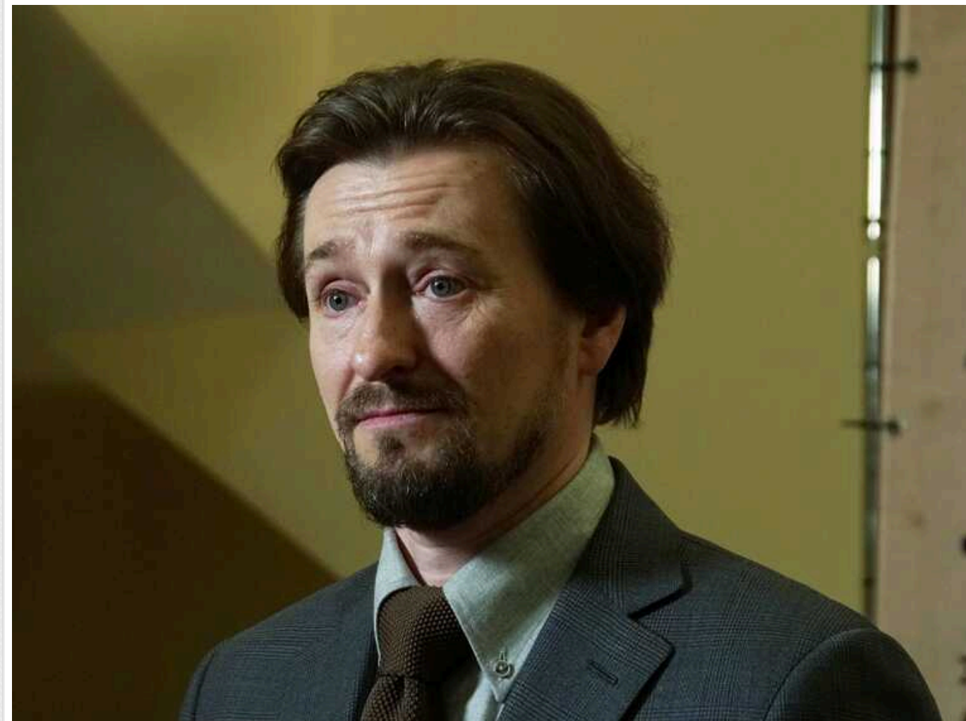
Підсанкційний Безруков, який знімався в Україні, вирішив створити філіал московського театру на Донбасі та назвав абсурдну причину

Відомий російський актор Сергій Безруков, який відкрито підтримує геноцид українців, за що є підсанкційним обличчям у багатьох цивілізованих країнах, виявив бажання викладати театральне мистецтво на тимчасово окупованому Донбасі. За словами путініста, українці дуже хочуть навчатися в нього, але не можуть дійхати до Москви.