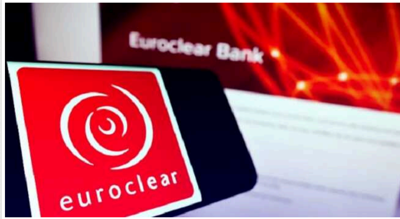
Глава Euroclear розкритикувала ідею використання заморожених активів РФ

Глава Euroclear – депозитарію, де зберігається лівова частка заморожених активів Центробанку Росії, – виступила проти пропозиції використати російські мільярди як заставу, під яку союзники України могли б випустити боргові зобов'язання для допомоги з відновленням країни. Натомість у Euroclear підтримують передачу Україні лише доходів від заморожених коштів РФ.