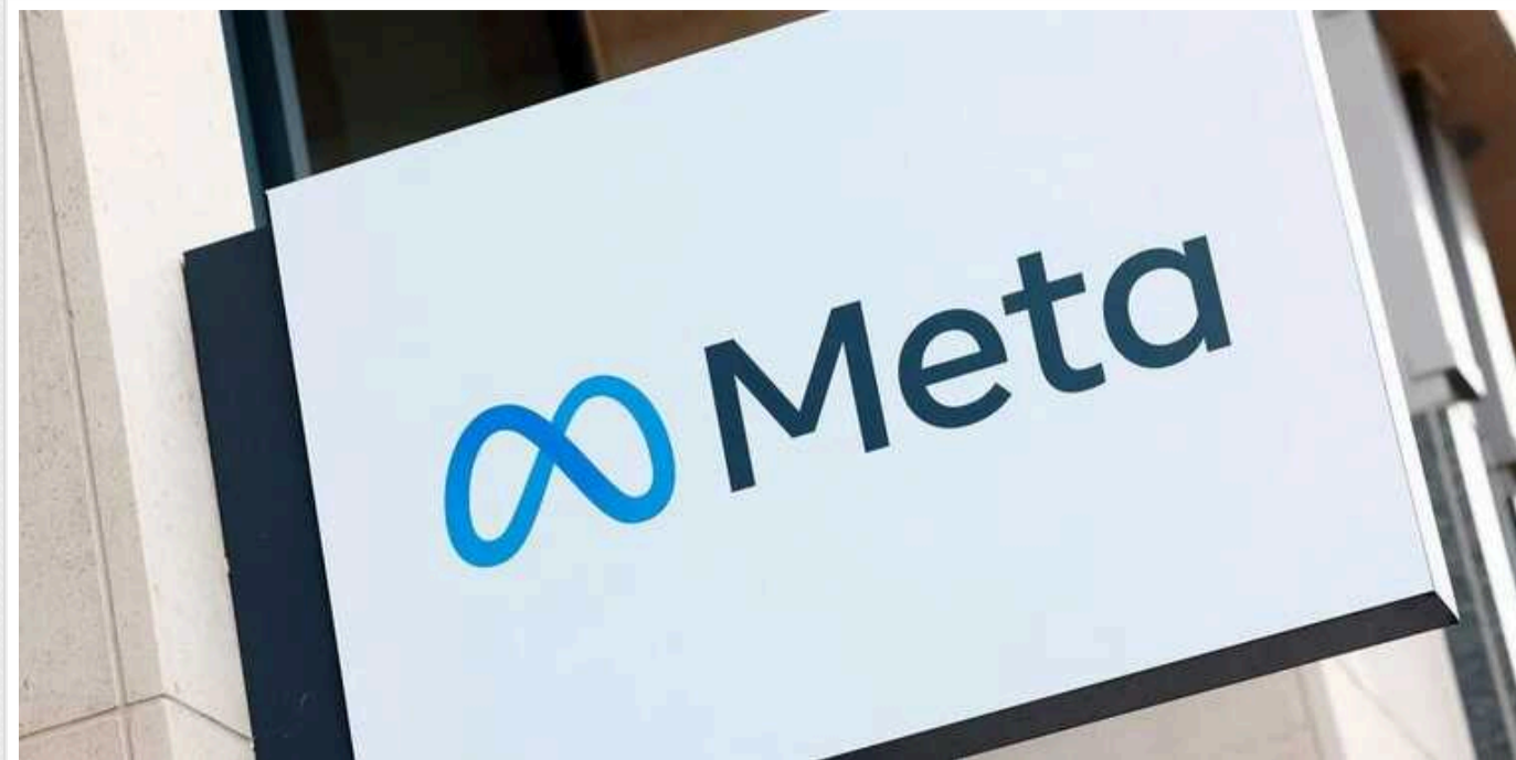
Головний вчений Meta переконаний, що ШІ досі дурніший за котів

Головний науковець Meta у сфері штучного інтелекту Ян ЛеКун переконаний, що людство не наблизилось не тільки створення загального штучного інтелекту, а й навіть до ШІ, розумнішого за котів.