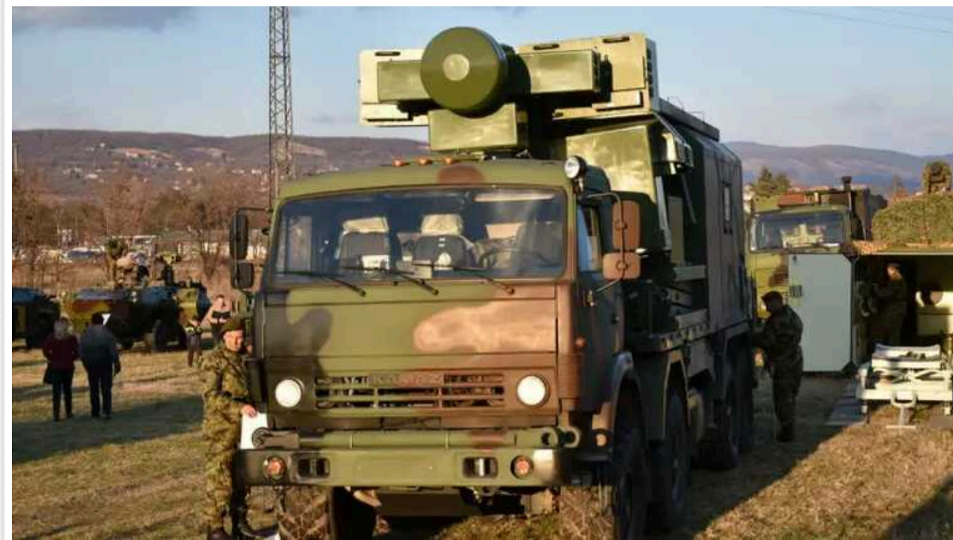
Попри міжнародні санкції, Сербія отримала партію зброї від РФ, - AP News

Агентство AP News повідомляє, що Сербія отримала партію зброї від Росії, попри міжнародні санкції.