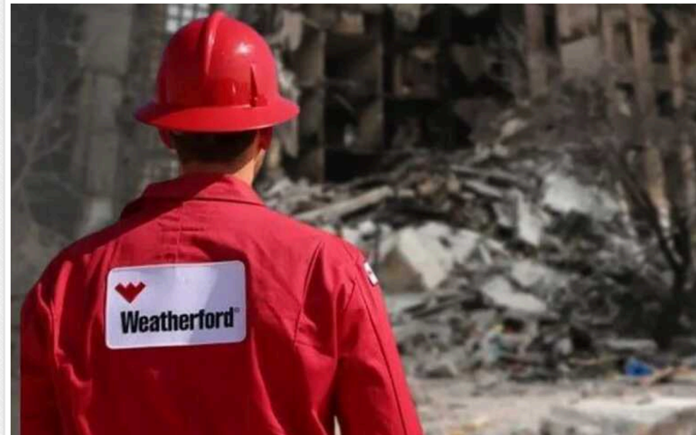
Оголошено нового міжнародного спонсора війни: Weatherford International допомагає Росії "піднімати" нафтову промисловість

Національне агентство із запобігання корупції (НАЗК) внесло ірландсько-американського виробника нафтовидобувного обладнання Weatherford International до переліку міжнародних спонсорів війни. Ця компанія продовжує тримати виробничі потужності у РФ і сплачувати там податки, при цьому посилюючи нафтовидобувну галузь РФ. А саме Нафтогаз є головним джерелом коштів, які Кремль використовує для війни проти України.