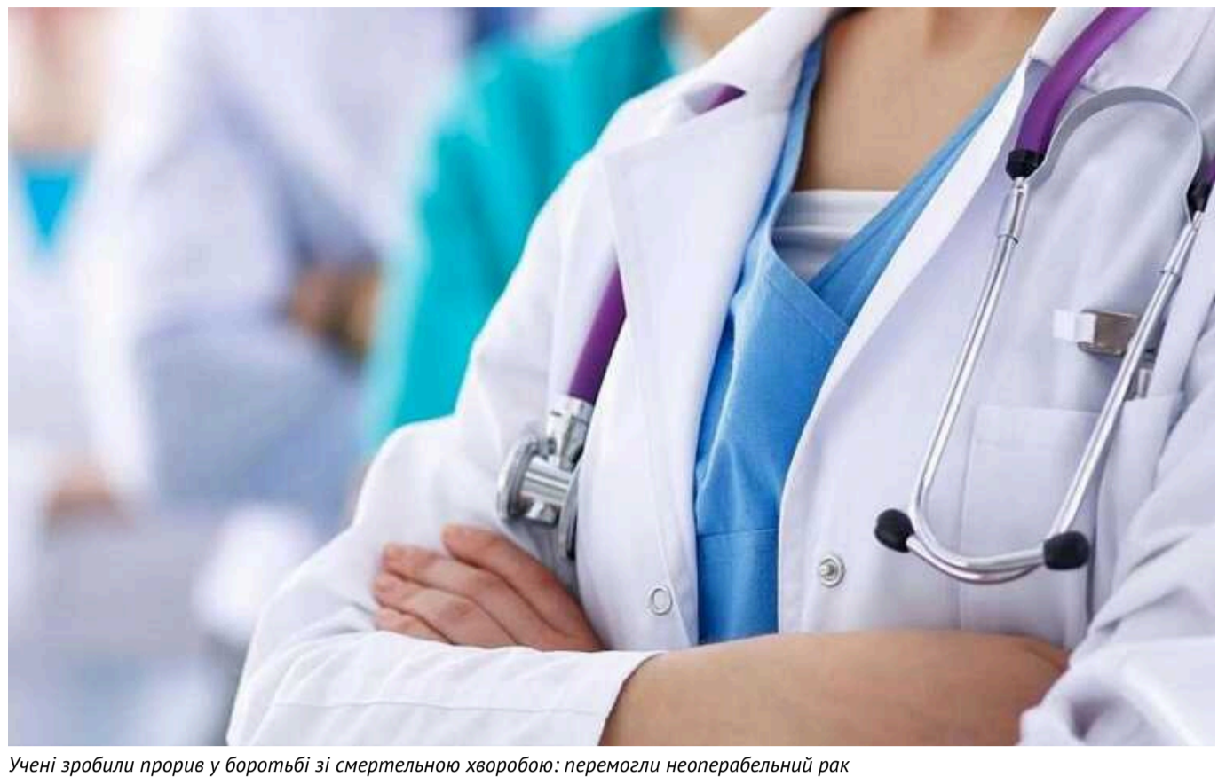
Учені зробили прорив у боротьбі зі смертельною хворобою: перемогли неоперабельний рак

Проведене дослідження дало дитині з неймовірно агресивною формою раку можливість вижити й перемогти смертельну хворобу, відкривши новий етап боротьби з небезпечними захворюваннями.