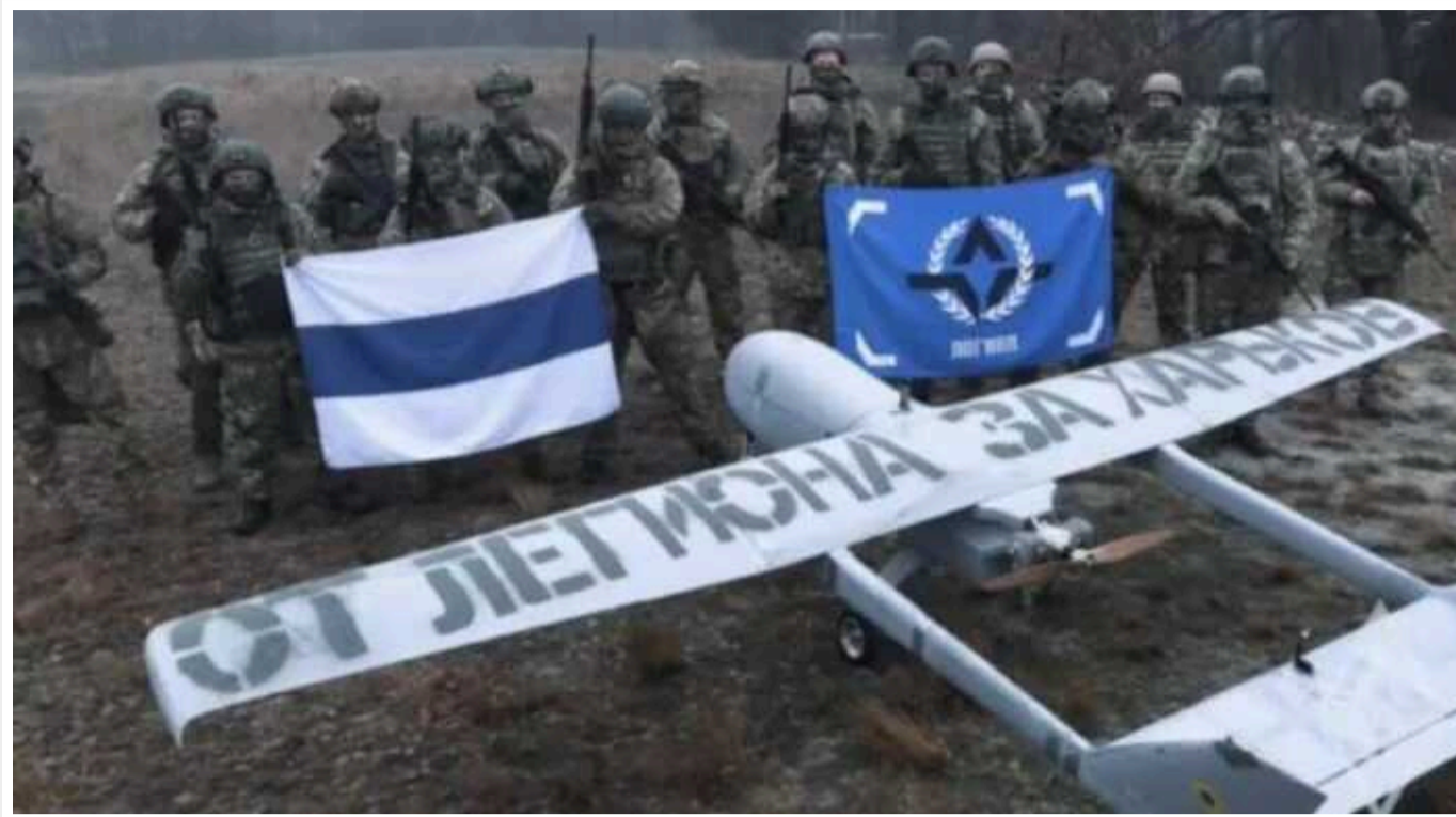
Бійці легіону "Свобода России" пообіцяли відповісти рашистам за удари по Харкову

Бійці легіону "Свобода России" пообіцяли відповісти путінським військам за удари по прикордонному Харкову.