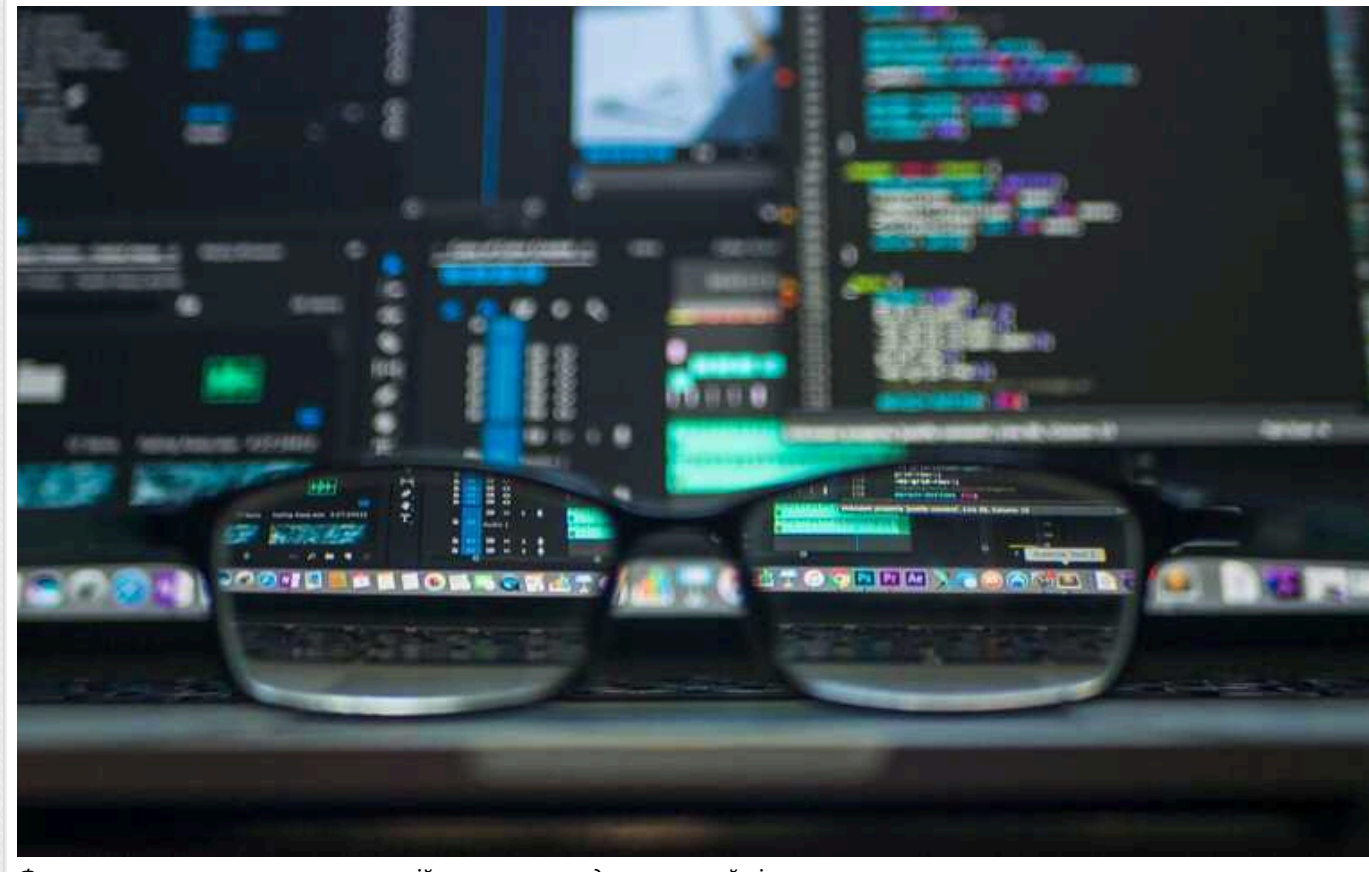
Французи викрили чергову мережу російських пропагандистських сайтів