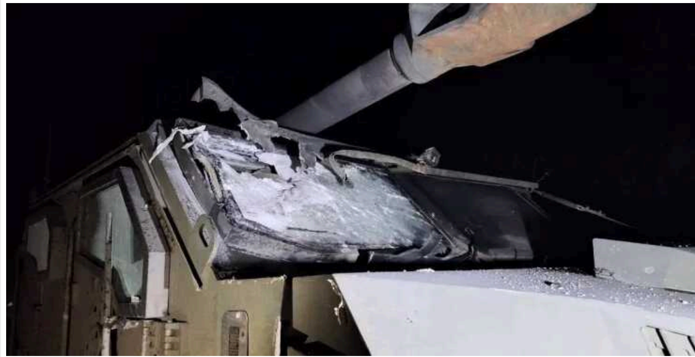
Українська САУ "Богдана" витримала удар російського "Ланцета"

Бронекапсула машини врятувала життя бійців екіпажу. Вони ж і показали наслідки від ураження російського дрона-камікадзе.