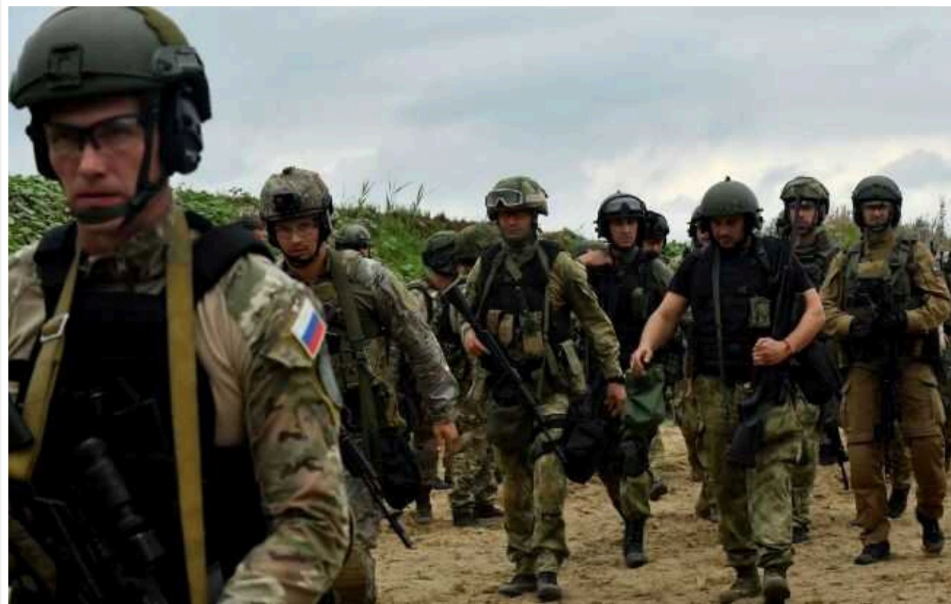
Найбільший відсоток в Європі: 80% фінів готові воювати, якщо РФ нападе, — соціолог