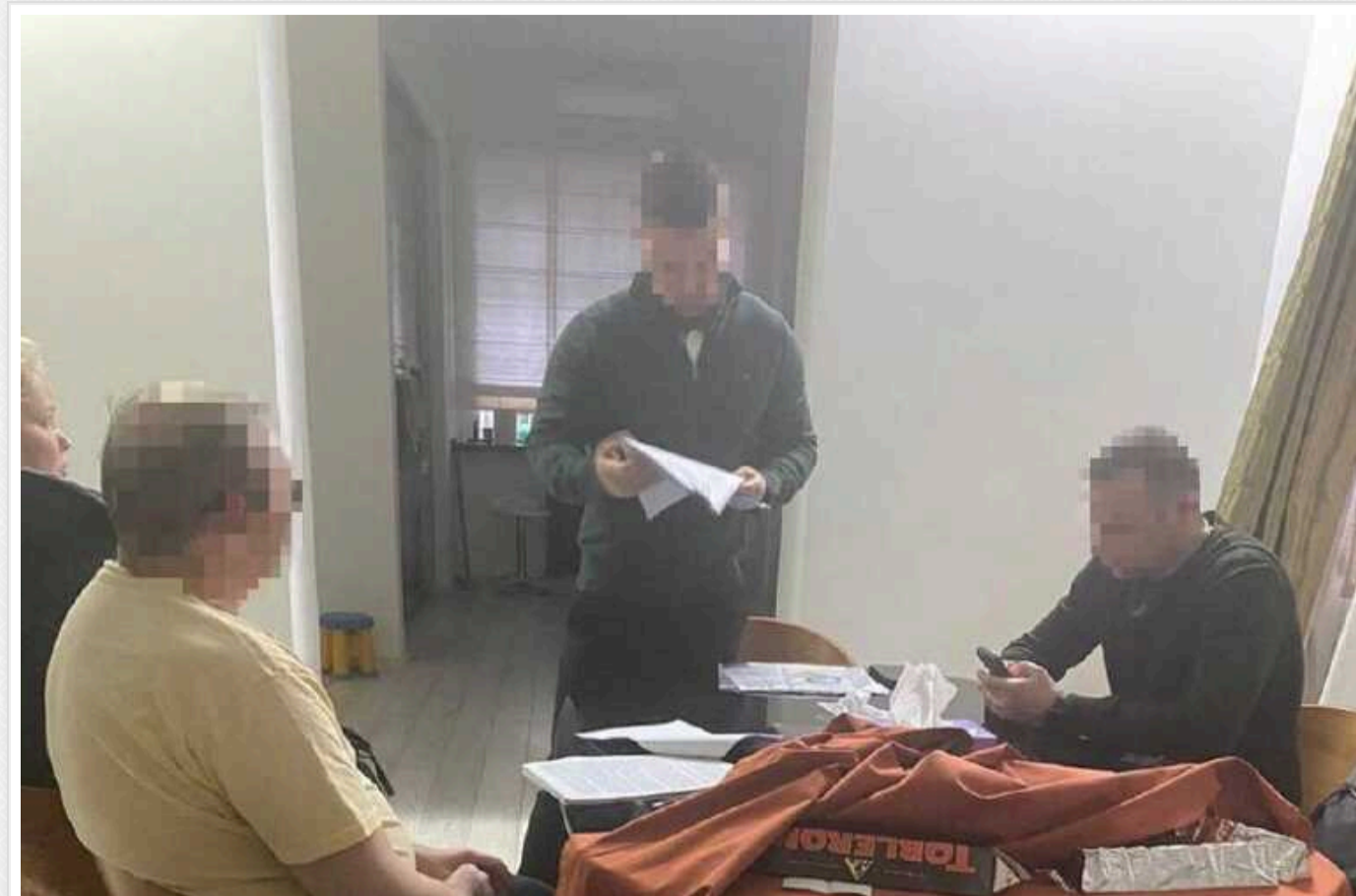
Ексзаступника голови правління банку «Фінанси та Кредит» затримали за зловживання

Вже третьому заступнику голови правління АТ «Банк «Фінанси та Кредит», який розікрав мільярди в інтересах власника – ексолігарха Константина Жеваго, висунули підозру у зловживаннях. Про це повідомляє ДБР.