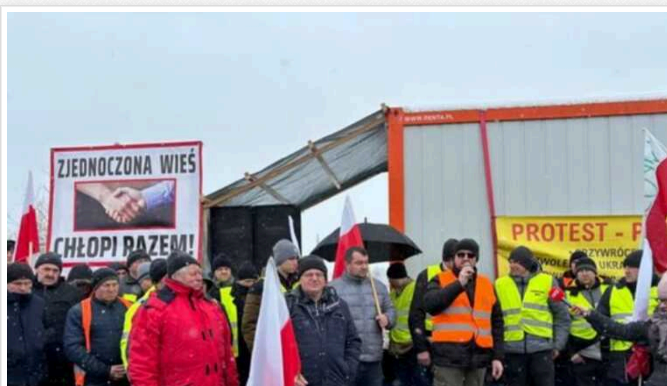
Великий страйк фермерів Польщі. «Серед вимог не лише Україна, але чомусь блокують саме український кордон»

У Польщі, на кордоні із Україною, не вихають протести. Фермери позржують 20 лютого заблокувати усі пункти пропуску на кордоні з Україною.