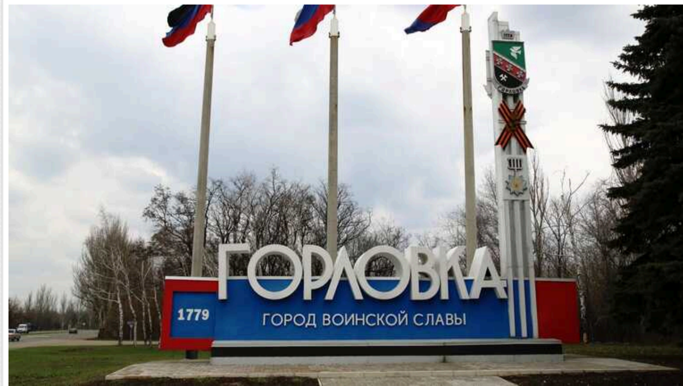
В окупаційній адміністрації Горлівки нема кому працювати. Списки вакансій вражають своїм розміром